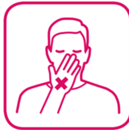
nicht ins Gesicht fassen