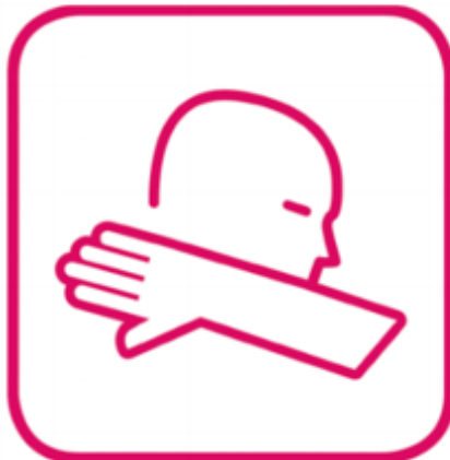
in die Armbeuge niesen