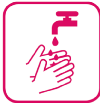
häufig Hände waschen